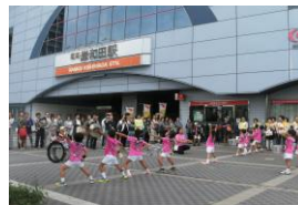
マーチング活動 (赤い羽根共同募金オープニング)