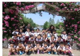
とんぼ池公園へのピクニック