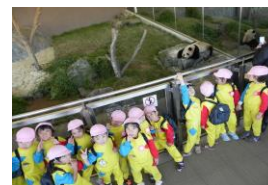
秋の遠足 (白浜アドベンチャーワールド)