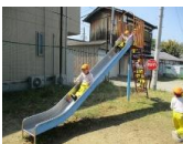
包近町内の公園でも遊具遊びを楽しみました