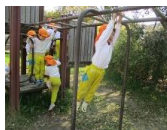
雲梯は毎年大人気！