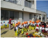
「いってらっしゃーい！」お見送りを受けながら出発