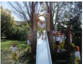
滑り台は園にもありますが子ども達にはまた違った感覚のようでした