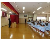
幼児クラス進級式。新しいクラスでもみんながんばってね！