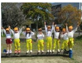
一ツ橋も順番待ちをするほどの人気でした