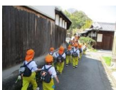
包近町内は迷路のようです