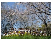
春を満喫しました！