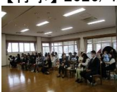
入園式。これからよろしく願いいたします