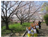
包近公園は桜が満開！