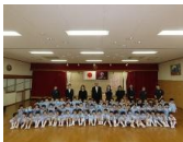
幼児3クラスの子ども達。希望に満ちた表情でした

本日4月1日より令和8年度がスタートしました。今日は朝から新入園児さんと保護者の皆様をお迎えし入園式を行いました。式典には年度初めの平日にも関わらず、多くの新入園児保護者の皆様にご参列頂きありがとうございました。明日2日より、新入園児さんを含めた教育・保育が始まりますが、ほとんどの新入園児さんは保護者の皆様のもとを離れる経験がないため、大きな不安を感じ泣いての登園になることと思いますが、少しでも不安が和らげられるよう、一人ひとりに応じた無理のない保育を進めて参ります。これから先生やお友達のあそぶ姿や行動に興味を持ち、次第に園生活に慣れていくと思いますので、ご家庭でも今日楽しかったこと、また給食のことなどお子様とたくさんお話してあげて下さいね。子ども達が一日でも早く園の生活に慣れ、心身ともに健やかな生活が送れるよう、保護者の皆様とともに教育・保育を進めて参りますので、これから一年どうぞよろしくお願い申し上げます。