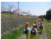
川沿いもきれいなお花がたくさん咲いていました

もも組さんの保育風景です。今日は朝から年度初め恒例の包近公園へピクニックに出掛けました。「いってらっしゃーい！」とすみれ組・ゆり組さんに見送られながら元気に園を出発した年長児もも組さん。行きは交通量の多い牛滝街道を歩いていきましたが、帰りは包近町内から牛滝川沿いを歩くルートで帰ってきました。小学校登下校の訓練、交通ルートの修得を兼ねて出掛けており、途中いろいろなルールを学びながら安全第一で無事包近公園へ到着。現地では写真のとおり桜が満開で、きれいなお花を楽しむ子、園には無い遊具で夢にあそぶ子など、春の陽気にもかかれながら思いっきり楽しみました。